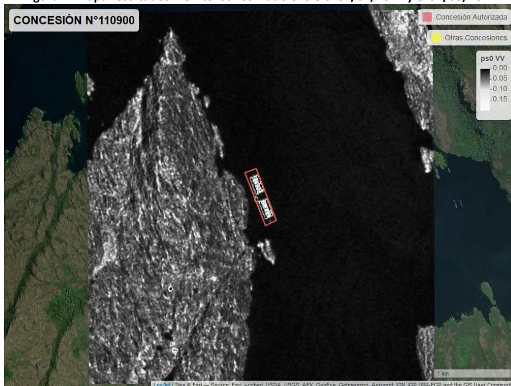
Figura 2. Mapa resultados monitoreo realizado entre el 01/02/2021 y el 31/03/2021

En las siguientes figuras se muestran las imágenes analizadas para cada periodo: