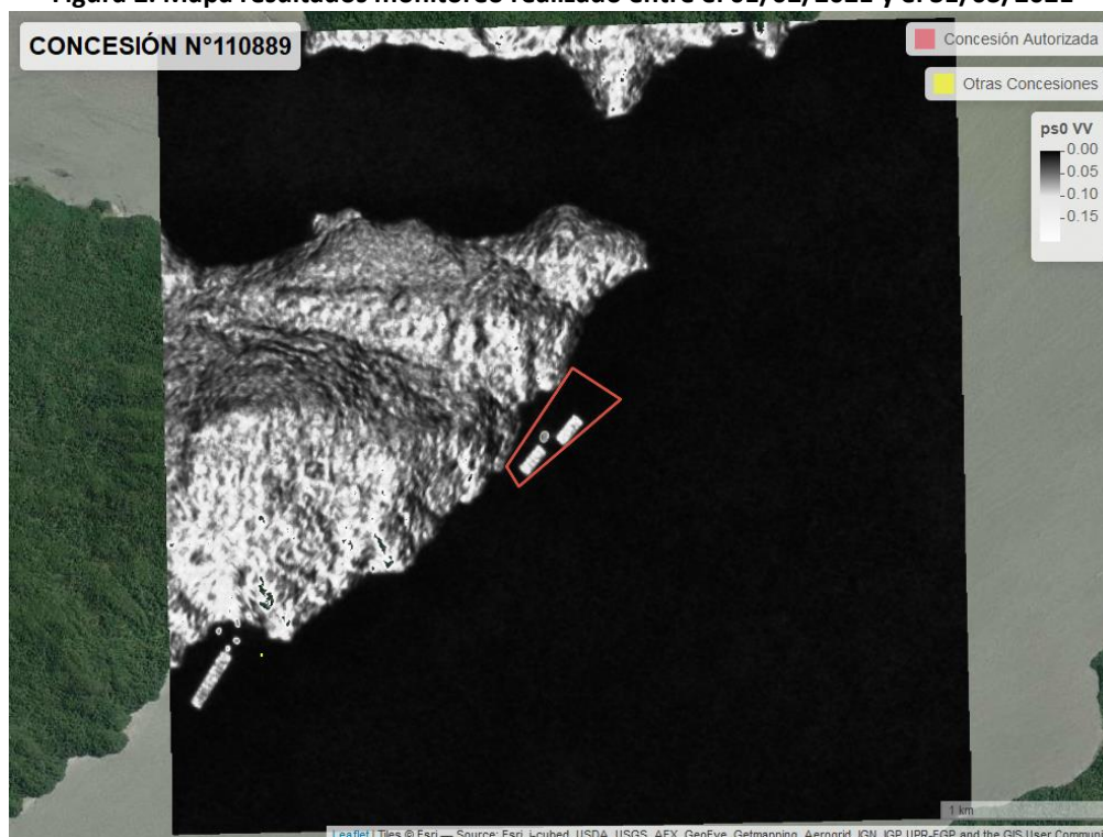
Figura 2. Mapa resultados monitoreo realizado entre el 01/02/2021 y el 31/03/2021

En las siguientes figuras se muestran las imágenes analizadas para cada periodo: