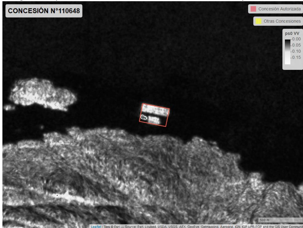
Figura 2. Mapa resultados monitoreo realizado entre el 01/02/2021 y el 31/03/2021

En las siguientes figuras se muestran las imágenes analizadas para cada periodo: