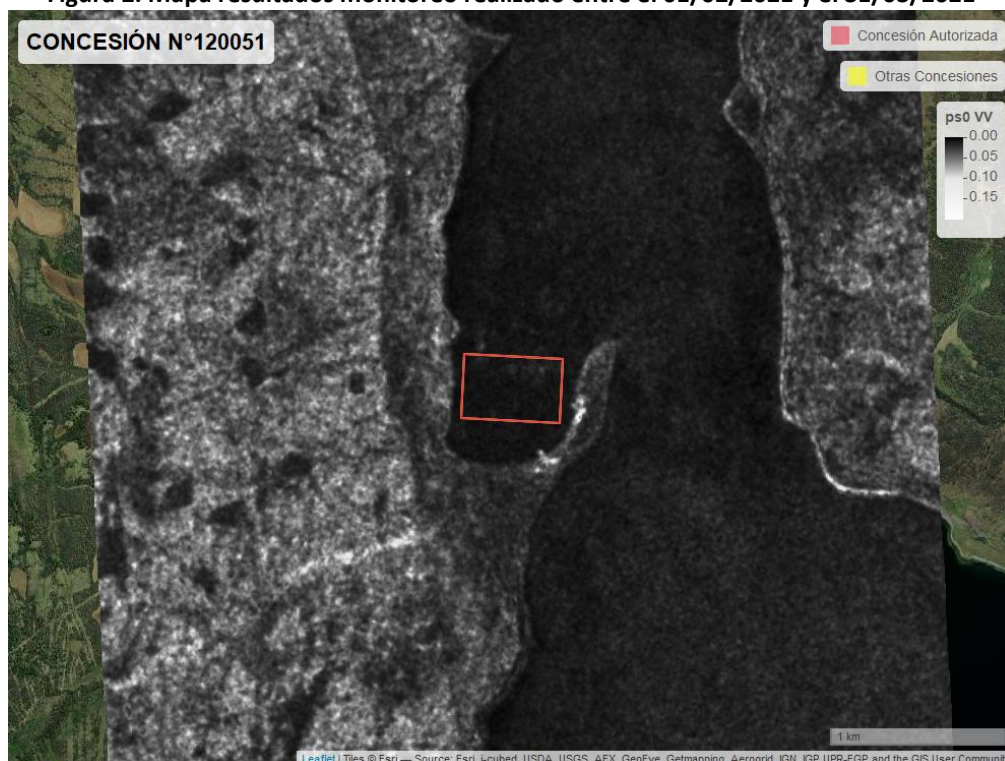
Figura 2. Mapa resultados monitoreo realizado entre el 01/02/2021 y el 31/03/2021

En las siguientes figuras se muestran las imágenes analizadas para cada periodo: