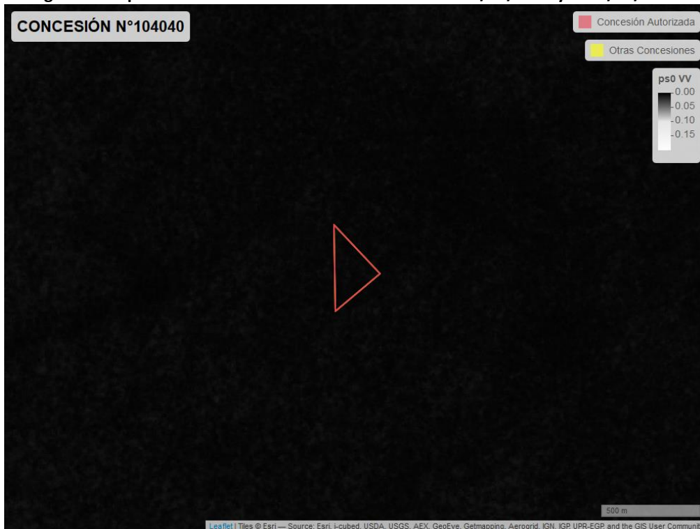
Figura 2. Mapa resultados monitoreo realizado entre el 01/02/2021 y el 31/03/2021

En las siguientes figuras se muestran las imágenes analizadas para cada periodo: