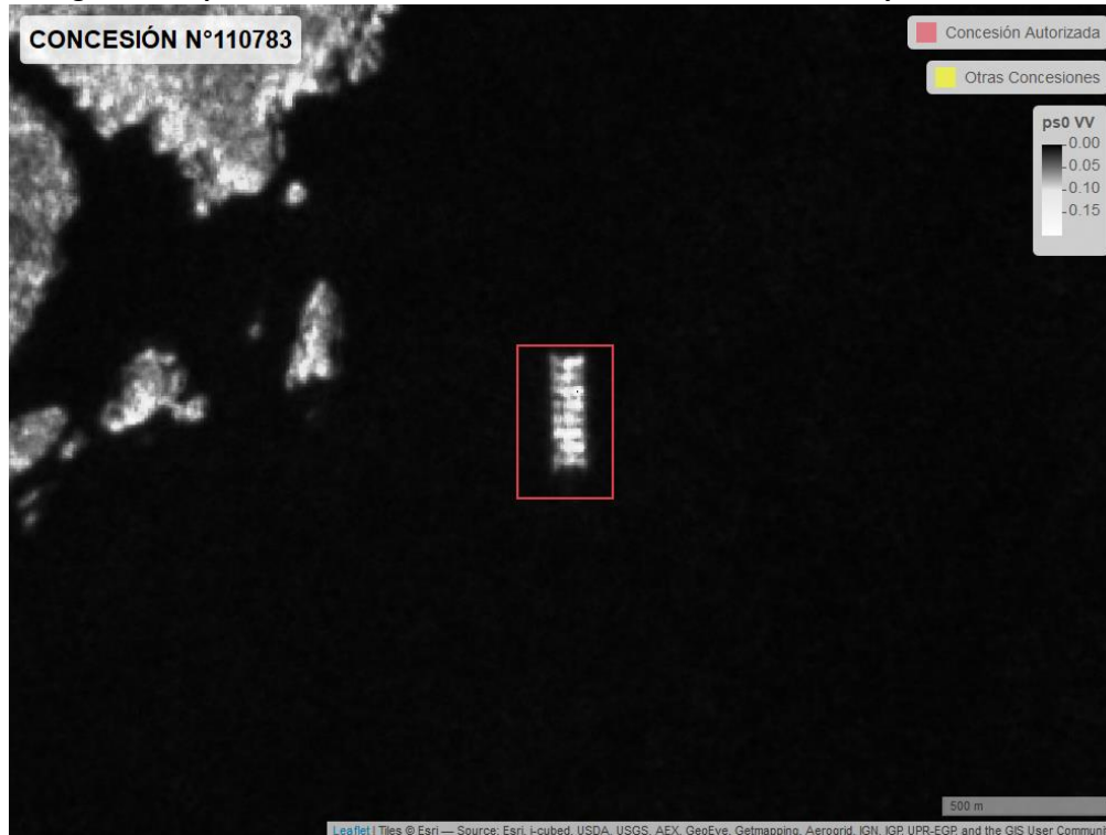
Figura 2. Mapa resultados monitoreo realizado entre el 01/02/2021 y el 31/03/2021

En las siguientes figuras se muestran las imágenes analizadas para cada periodo: