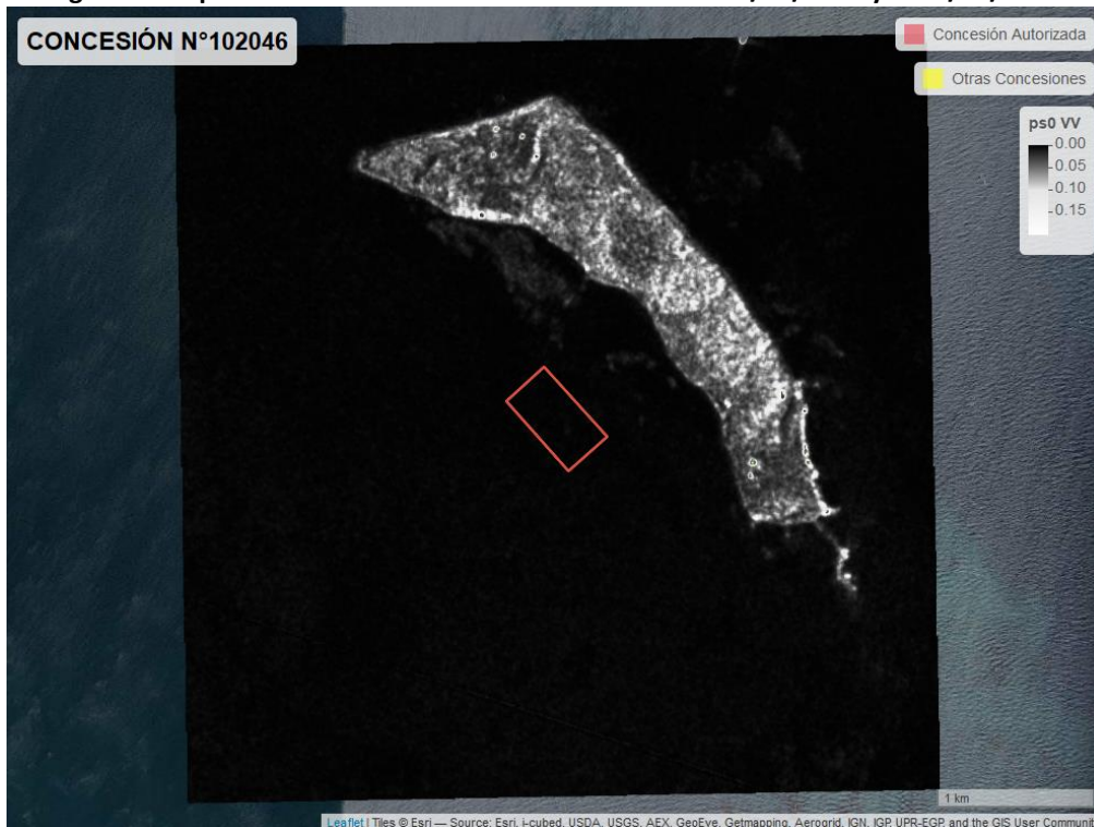
Figura 2. Mapa resultados monitoreo realizado entre el 01/02/2021 y el 31/03/2021

En las siguientes figuras se muestran las imágenes analizadas para cada periodo: