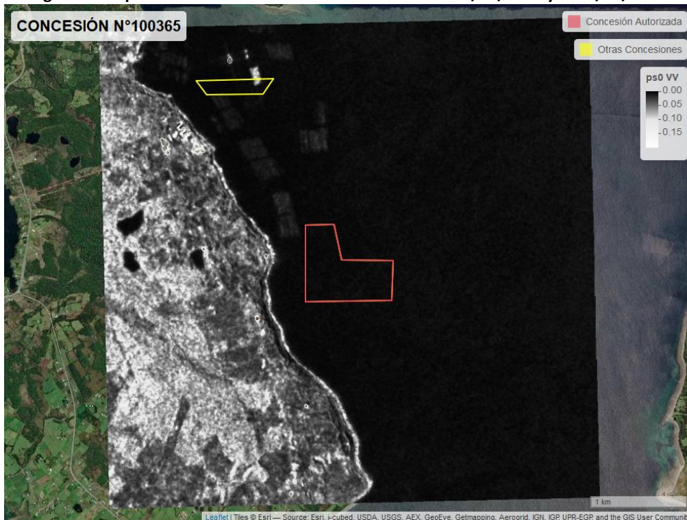
Figura 2. Mapa resultados monitoreo realizado entre el 01/02/2021 y el 31/03/2021

En las siguientes figuras se muestran las imágenes analizadas para cada periodo: