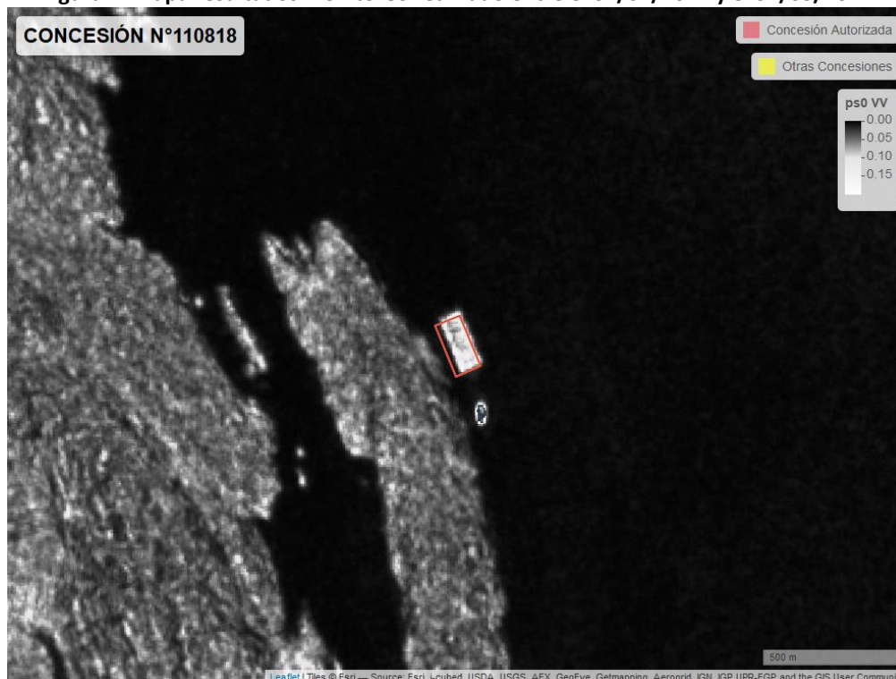
Figura 2. Mapa resultados monitoreo realizado entre el 01/02/2021 y el 31/03/2021

En las siguientes figuras se muestran las imágenes analizadas para cada periodo: