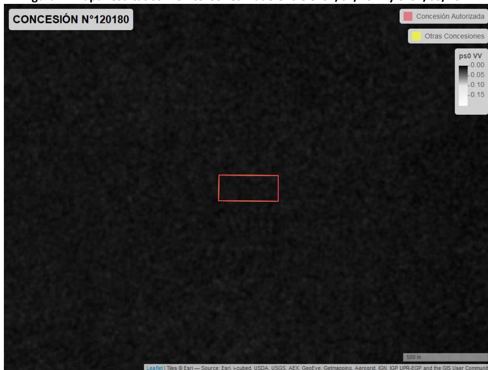
Figura 2. Mapa resultados monitoreo realizado entre el 01/02/2021 y el 31/03/2021

En las siguientes figuras se muestran las imágenes analizadas para cada periodo: