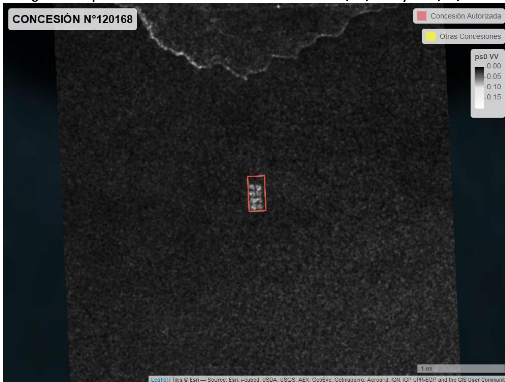
Figura 2. Mapa resultados monitoreo realizado entre el 01/02/2021 y el 31/03/2021

En las siguientes figuras se muestran las imágenes analizadas para cada periodo: