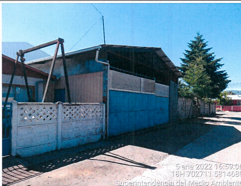
Imagen 1. Fotografía del taller con dirección Jahuel N° 155 (esquina Toltén), Angol.