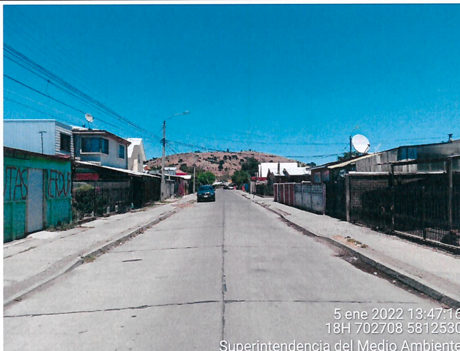
Imagen 1. Fotografía de calle Berlín a la altura del 0600, Angol.