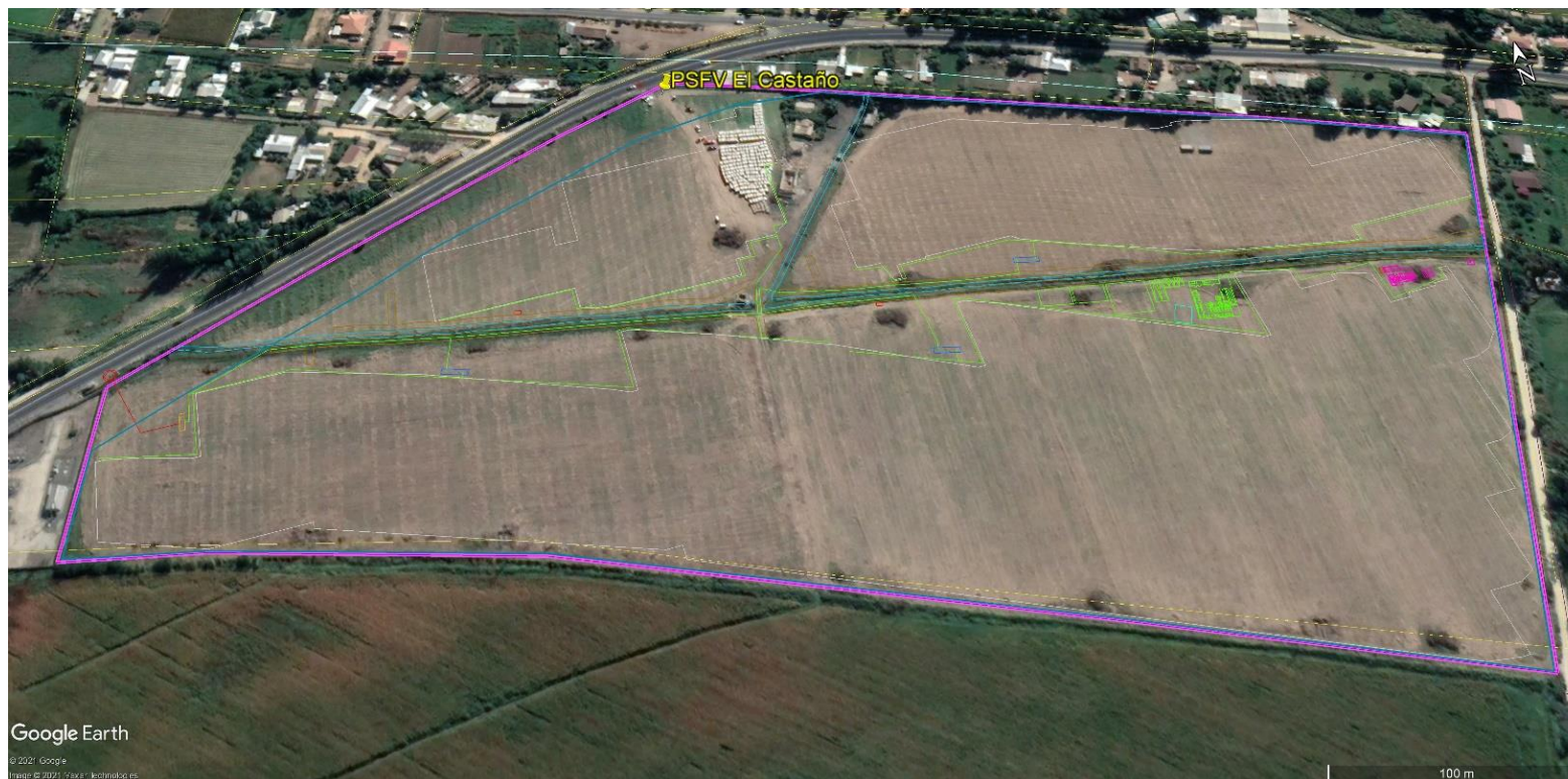
Figura 2. Layout.