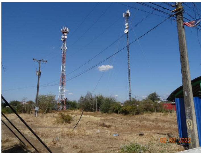
Imagen 1. Recintos de antenas de telecomunicaciones vistos desde calle M. Rodríguez de la localidad de Mininco.