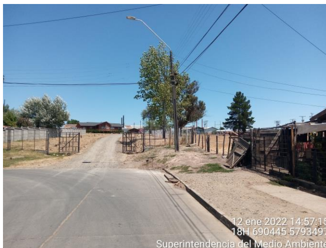
Imagen 1. Sector de emplazamiento de la Planta Agrisol de Los Sauces.