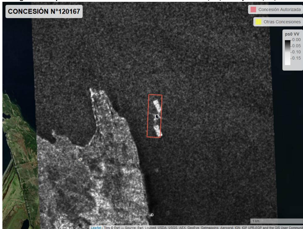
Figure 2: Mapa resultados monitoreo realizado entre el 01/02/2021 y el 31/03/2021

En las siguientes figuras se muestran las imágenes analizadas para cada periodo: