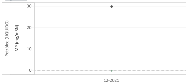
Figura N°1 - Resumen horas reportadas para Material Particulado (MP) - Año 2021

Datos de MP medidos durante las horas de régimen :