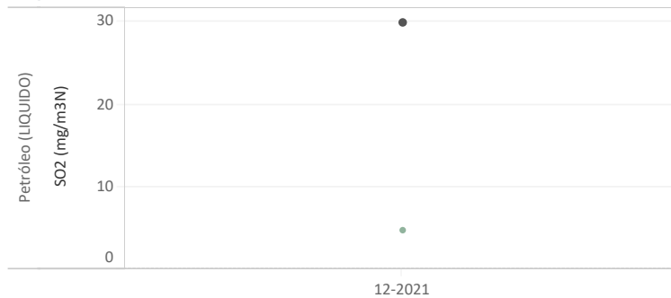
Figura Nº2 - Resumen horas reportadas para Dióxido de Azufre (SO 2 ) - Año 2021