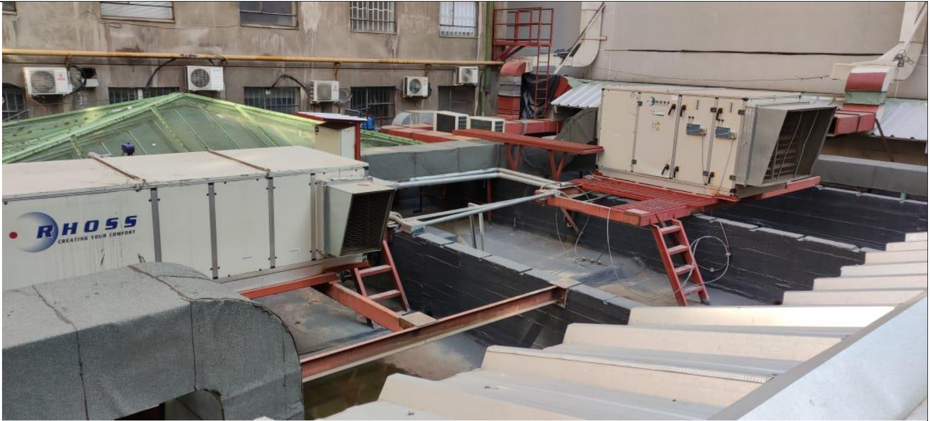
Figura 3. Equipos en techo de Mall Vivo Imperio.