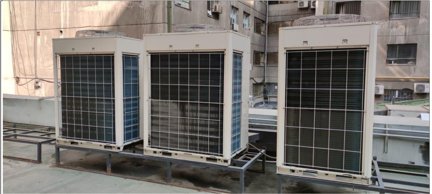
Figura 5. Equipos en techo de Mall Vivo Imperio.