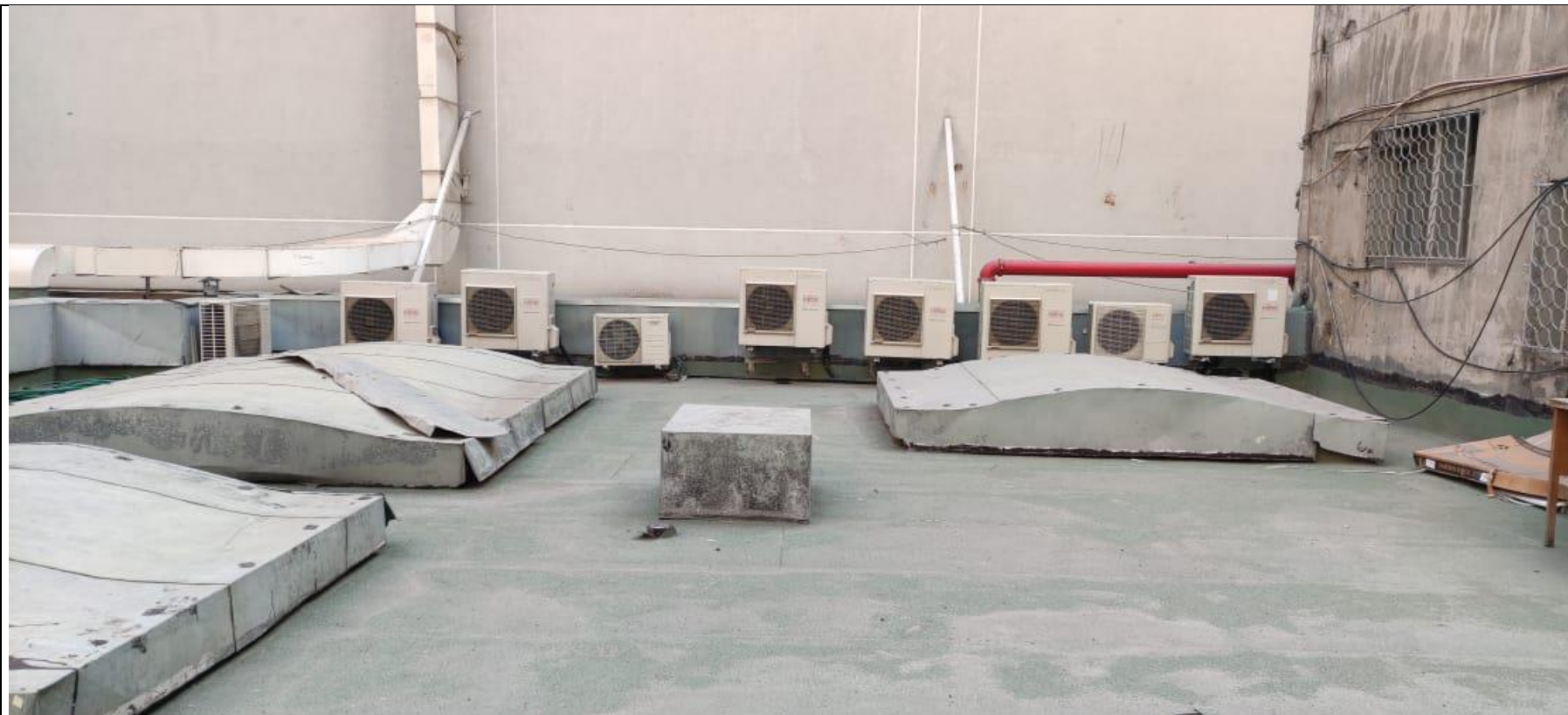
Figura 6. Equipos en techo de Mall Vivo Imperio.