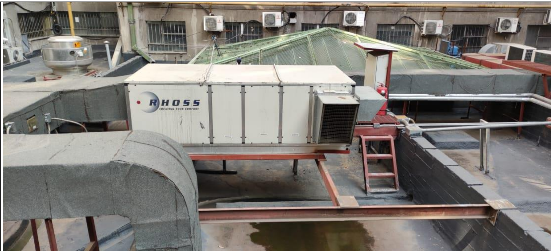
Figura 4 Equipos en techo de Mall Vivo Imperio.