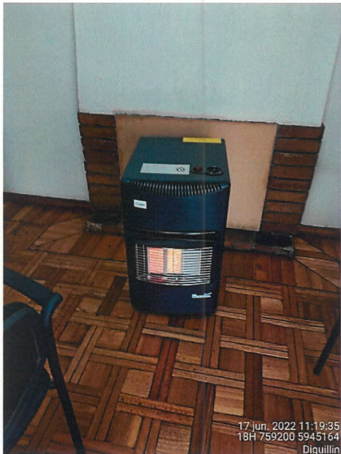
Equipo a gas.