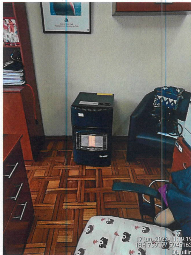
Equipo a gas.