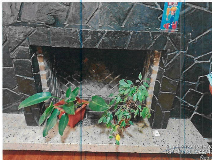
Equipo a leña deshabilitada.