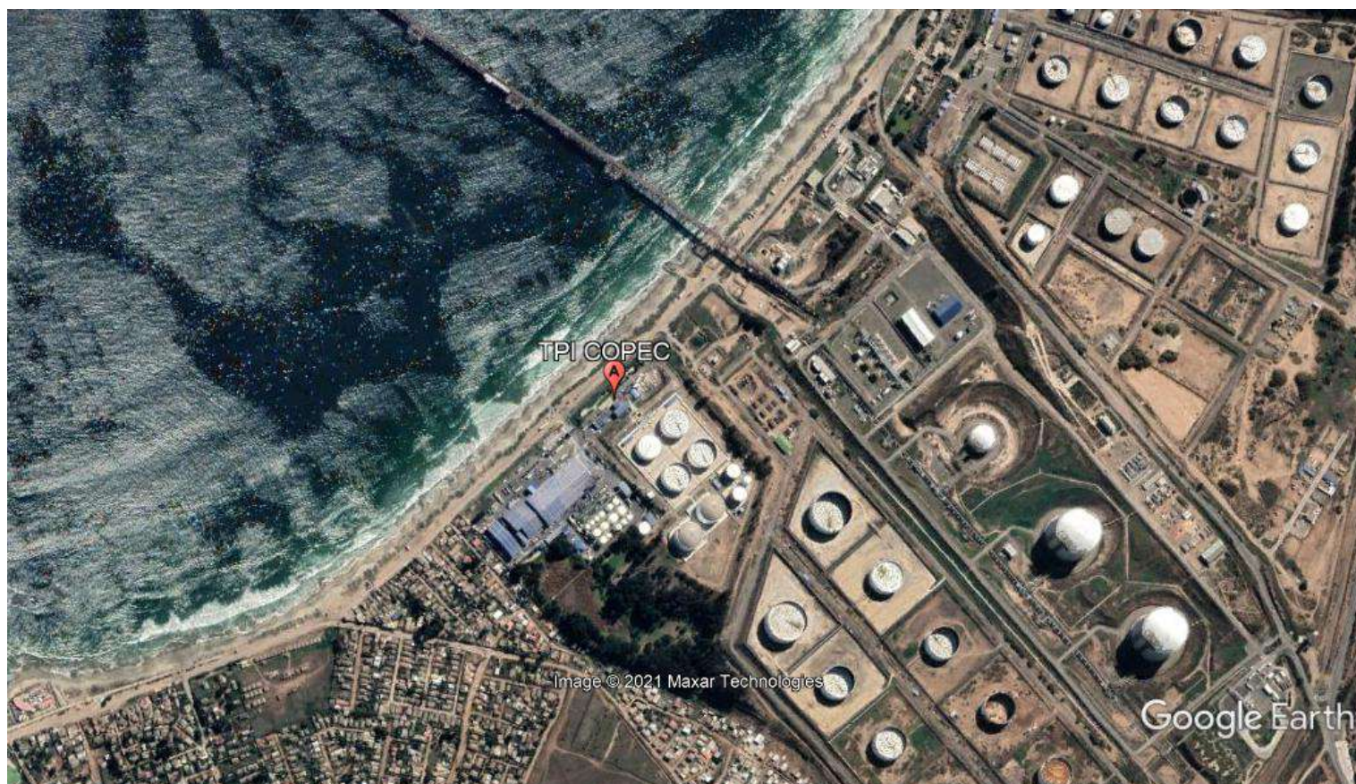
Figura 1. Mapa de ubicación local (Fuente: Imagen satelital, Google Earth Pro, 2021).