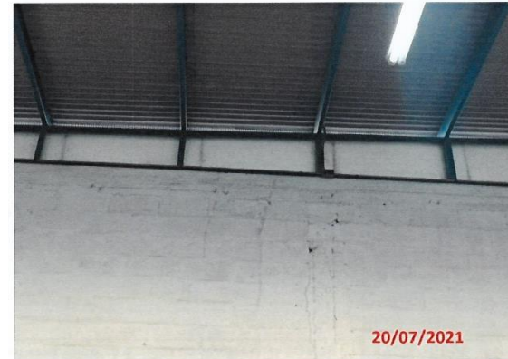
Imagen 1. Fuente: Programa de cumplimiento simplificado (ver anexo 6)

Imagen 2. Fuente: Programa de cumplimiento simplificado (ver anexo 6)