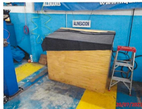
Imagen 3.