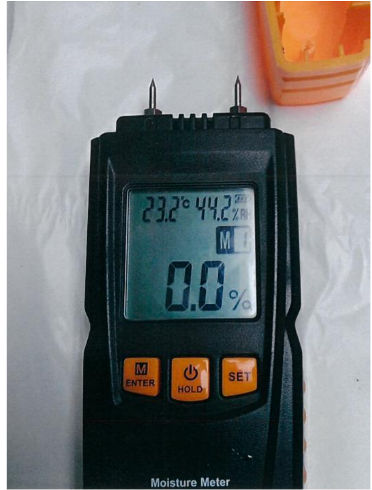
Imagen 1. Fecha: 18-02-2022

Simpson N°1492, Coyhaique -45,581317 LAT -72,055824 LONG 18/02/2022