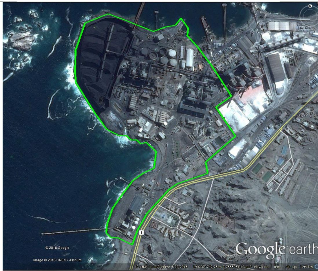
Figura 2 Mapa Ubicación Local Central Termoeléctrica Tocopilla