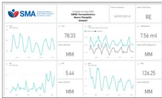
Imagen Conexión en línea para Central Termoeléctrica Nueva Tocopilla con los Sistemas Informáticos SMA

La SMA emite ORD. N° 1484 de fecha 16 de junio de 2022, indicando que aprueba la conexión en línea para la Central Termoeléctrica Nueva Tocopilla, presentada por AES Andes S.A., considerando que cumple con las instrucciones establecidas por esta Superintendencia para estos efectos.