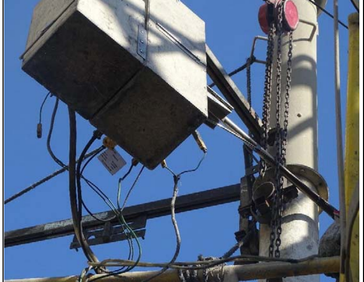
Fotografía N°2: Actividad de inspección 06-06-2022. Ducto fuente tipo proceso PR-11999.