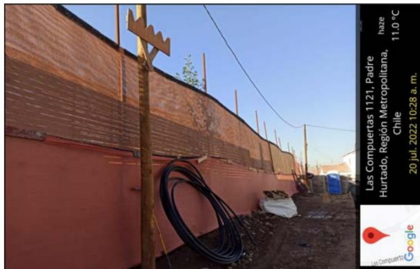
Fotografía 2 y 3