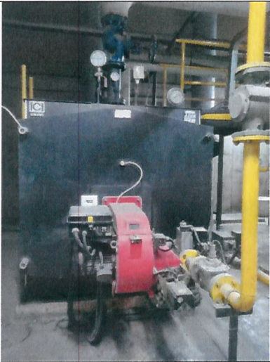
Fotografía 2. Caldera de planta Fanaloza, detenida al momento de la inspección.

Durante el recorrido no se observan fuentes nuevas, de acuerdo a lo establecido en el PPDA Concepción Metropolitano.