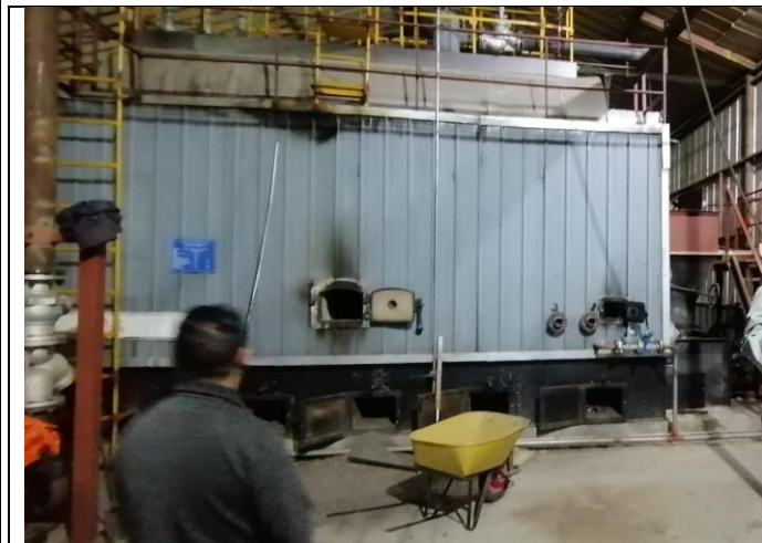
Fotografía 1. Caldera SPBIOBIO-415 – Vicsa

Respecto del registro de la caldera SPBIOBIO-415, en el año 2021 el titular informó sobre el registro regional de esta según el D.S. N°10/2012 del Ministerio de Salud, que aprueba el Reglamento de Calderas, Autoclaves y Equipos que utilizan vapor de agua. Sin embargo, a la fecha de la inspección el titular no ha reportado el Informe Técnico individual de esta.