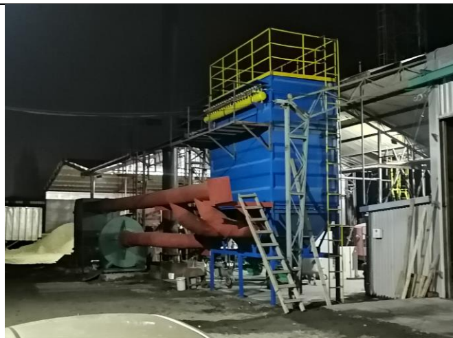
Fotografía 2. Filtro de mangas Caldera SPBIOBIO-415 – Vicsa

Por otro lado, cabe señalar que durante las inspecciones realizadas en el año 2021, se dejó establecido que el titular deberá contar con el catastro de la fuente fija en el Sistema de Seguimiento Atmosférico (SISAT) de esta Superintendencia, de acuerdo con la Resolución Exenta N°2452, de 10 de diciembre de 2020 que aprueba “Protocolo de Conexión en Línea y Reporte de Variables Operacionales para la Verificación de Compromisos Ambientales”. A la fecha de la inspección el titular aún no ha realizado dicho catastro.