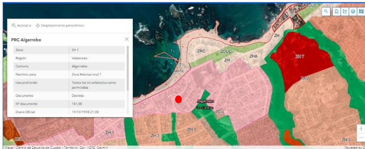
Figura N°2: Zonificación del área según Plan Regulador Comunal (PRC) de Algarrobo.

Se aprecia que la ubicación del receptor (punto rojo) se encuentra en zona habitacional 1 (ZH1).