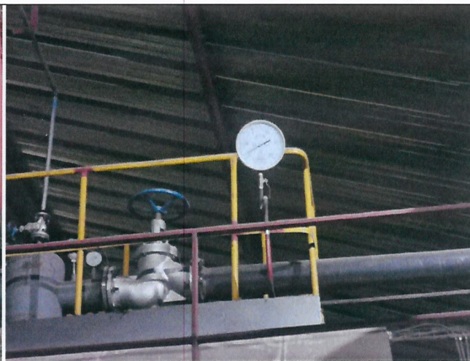
Fotografía 2. Filtro de mangas Caldera SPBIOBIO-415 – Vicca

Por otro lado, cabe señalar que durante las inspecciones realizadas en el año 2021, se dejó establecido que el titular deberá contar con el catastro de la fuente fija en el Sistema de Seguimiento Atmosférico (SISAT) de esta Superintendencia, de acuerdo con la Resolución Exenta N°2452, de 10 de diciembre de 2020 que aprueba "Protocolo de Conexión en Línea y Reporte de Variables Operacionales para la Verificación de Compromisos Ambientales". A la fecha de la inspección el titular aún no ha realizado dicho catastro.