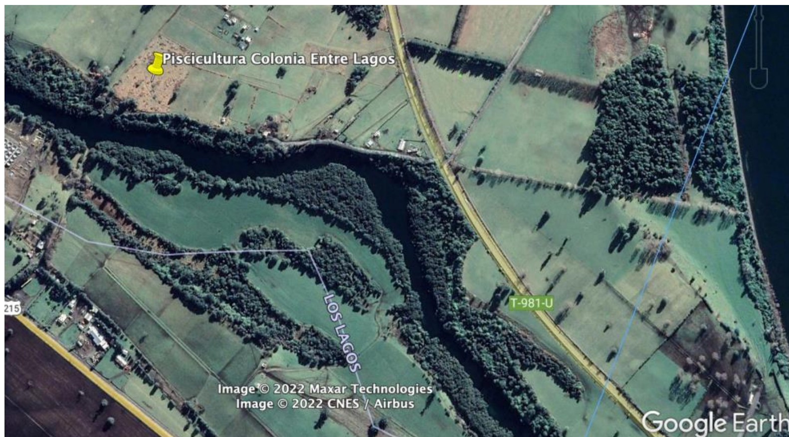
Figura 1. Mapa de ubicación general del proyecto: Piscicultura Colonia Entre Lagos.

Coordenadas UTM de referencia: DATUM WGS 84