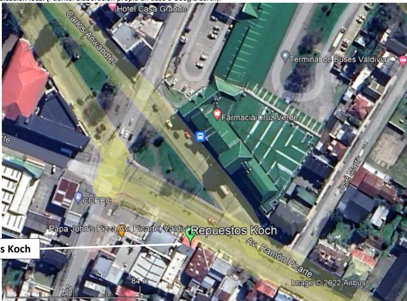
Figura 1. Mapa de ubicación local (Fuente: Elaboración propia en base a Google Earth).