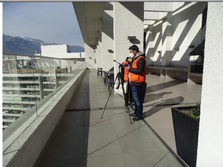
Fotografía N° 3: Actividad de inspección 29-06-2022. Medición en el receptor AD3.