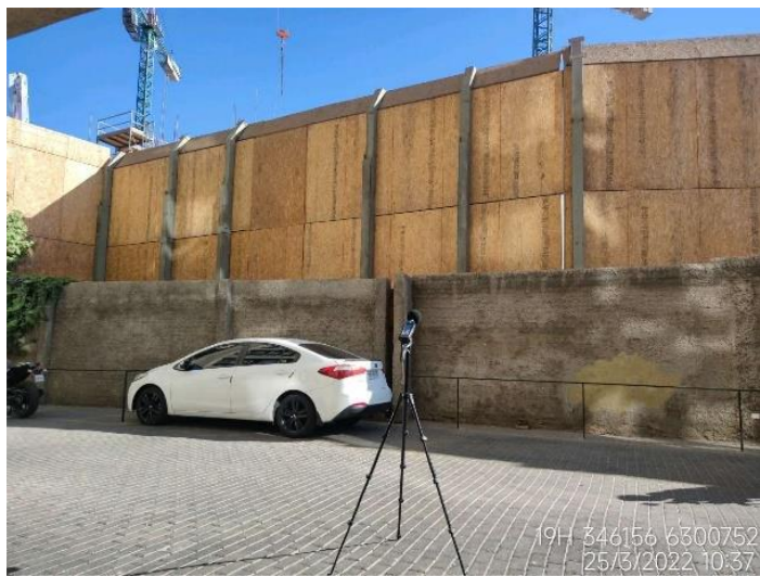
Fotografía N°5: Imágenes del receptor N° 1 de la actividad de medición contenida en informe de resultados de la ETFA INF_INS N°093752021_Mar2022_vA (página 36).