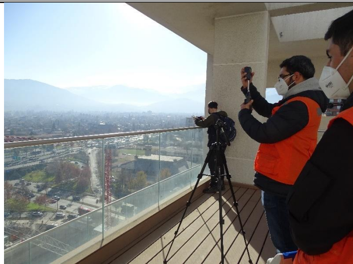
Fotografía N°1: Actividad de inspección 29-06-2022. Medición en el receptor AD1