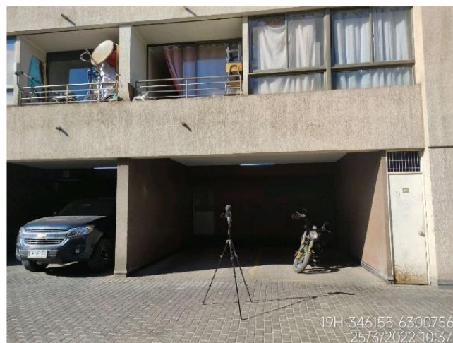
Fotografía N°6: Imágenes del receptor N° 1 de la actividad de medición contenida en informe de resultados de la ETFA INF_INS N°093752021_Mar2022_vA (página 36).