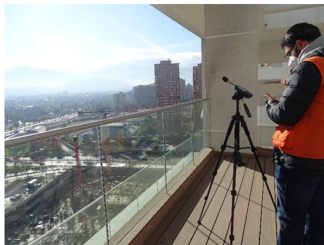
Fotografía N°2: Actividad de inspección 29-06-2022. Medición en el receptor AD2.