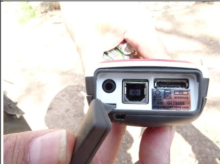
Fotografía N° 3: Actividad de inspección 27-09-2022. Etiqueta de fábrica del sonómetro.