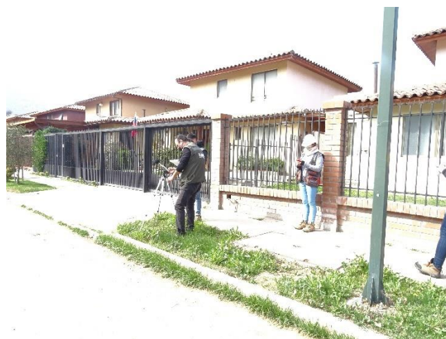
Fotografía N°2: Actividad de inspección 27-09-2022. Segundo lugar de medición de ruido de fondo asociada al receptor N° 2