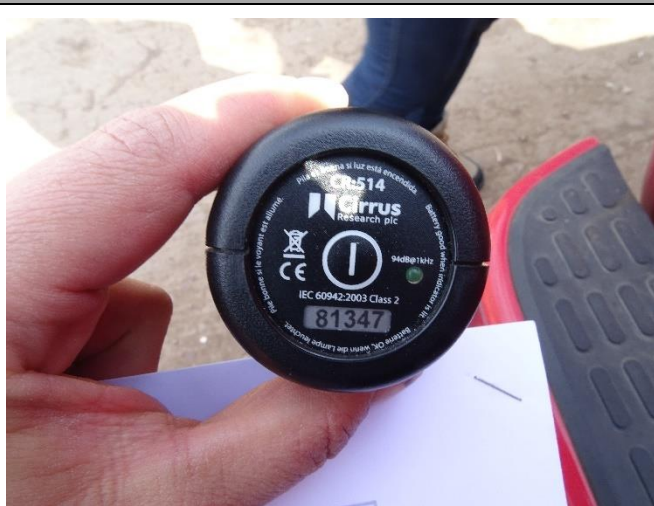
Fotografía N°4: Actividad de inspección 27-09-2022. Etiqueta de fábrica del calibrador.