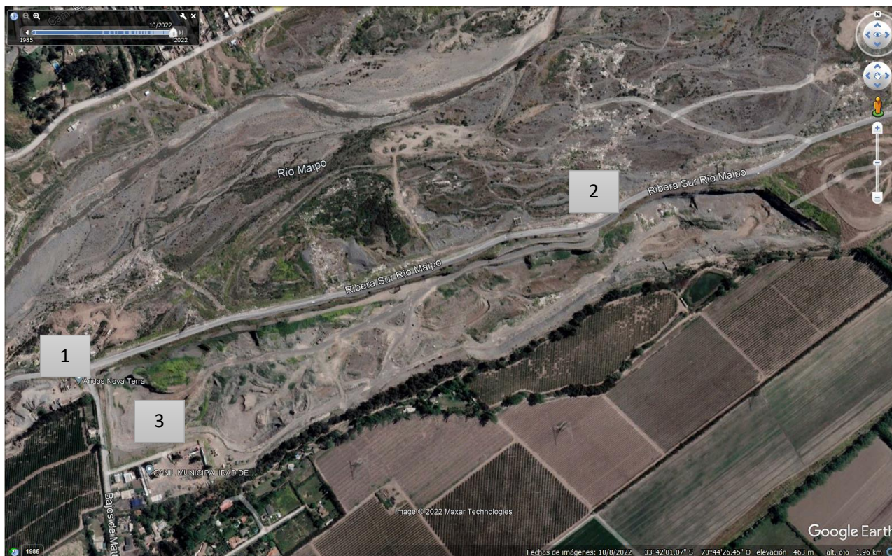
Figura 4 Esquema del Recorrido (Fuente: Elaboración propia a partir de Imagen Satelital - Google Earth, 2022).