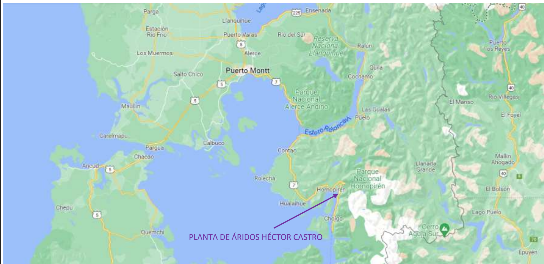
Figura 1. Mapa de ubicación local

Coordenadas UTM de referencia: DATUM WGS 84