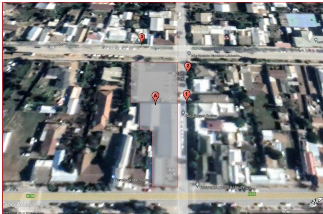
Figura 2. Ubicación en el mapa de los dos receptores R1-R2 Y R3 y ubicación de fuente emisora “Supermercado San Nicolas”