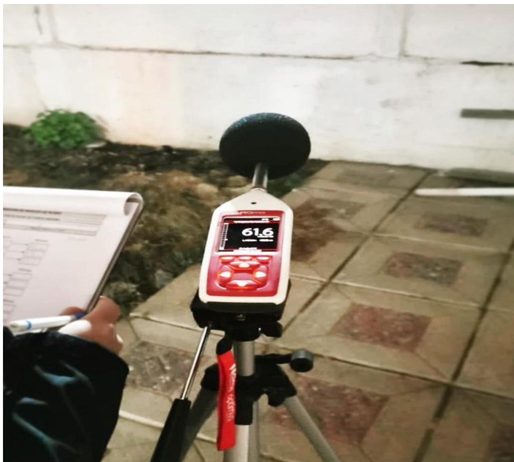
Figura 4. Medición Nivel de Presión Sonora, en periodo nocturno, receptor 2 SMA