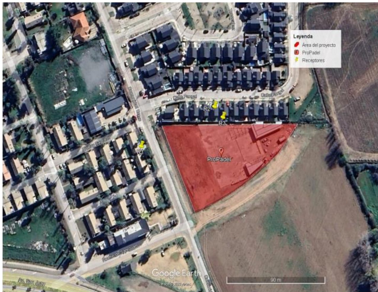
Figura 1. Ubicación de los receptores identificados y Unidad Fiscalizable