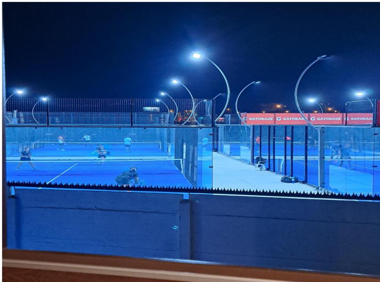
Figura 2. Vista desde propiedad del denunciante a Canchas de Padel colindantes con muro perimetral