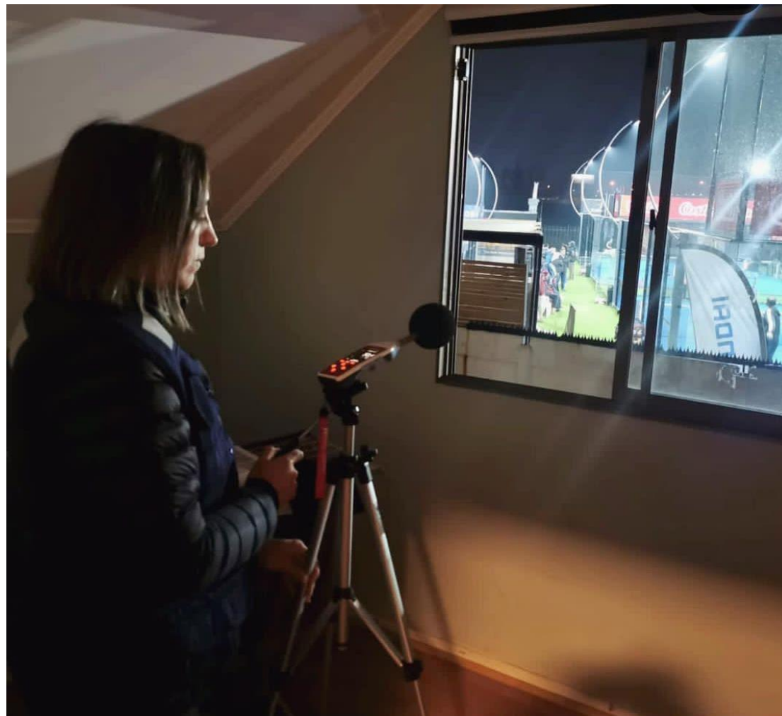
Figura 6. Casa de denunciante receptor 2, medición de ruido en segundo piso