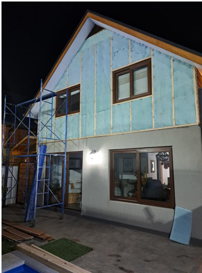
Figura 5. Casa de denunciante receptor 1, instalación de aislación segundo piso, ventanas tipo termopanel