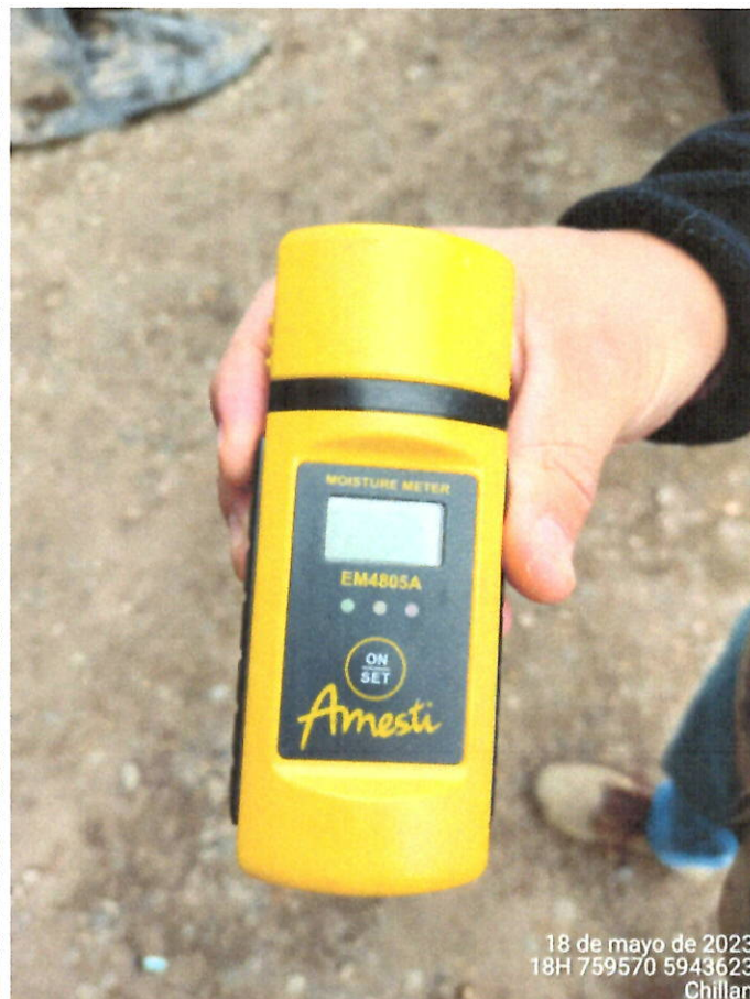
Xilohigrómetro presente en el local