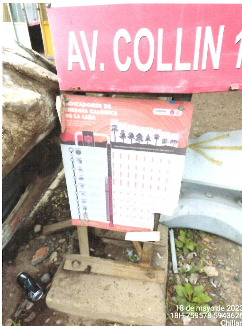
Tabla de conversión presente en el local