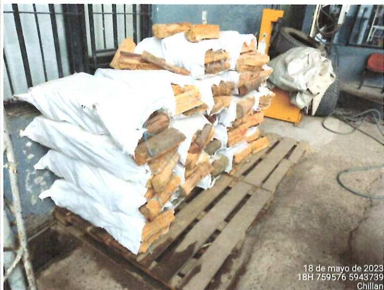
Lugar de disposición de la leña para la venta