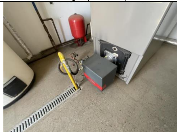
Fotografía N°4: Quemador de caldera a gas.