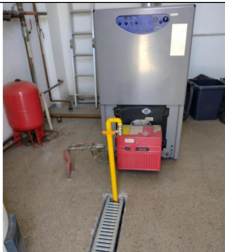
Fotografía N°1: Caldera (fotografía entregada por el titular).