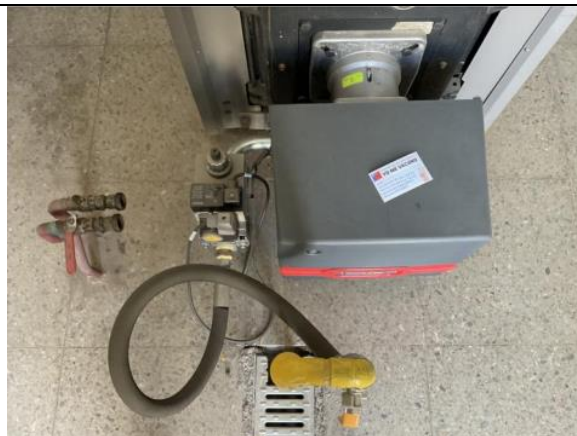
Fotografía N°3: Quemador de caldera a gas.