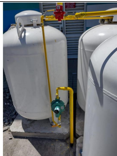
Fotografía N°2: 3 estanques de Gas Licuado de Petróleo.