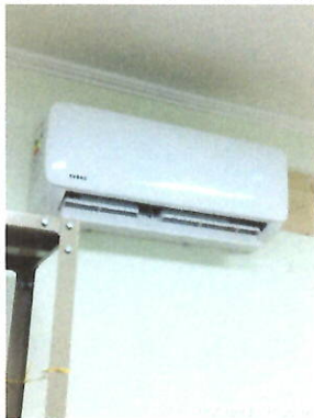
Foto de referencia de Equipo eléctrico