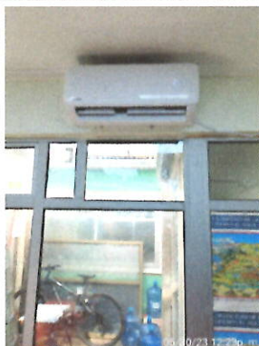
Foto de referencia de Equipo eléctrico