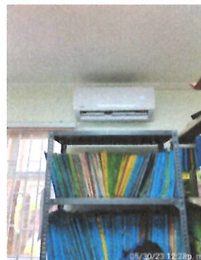
Foto de referencia de Equipo eléctrico