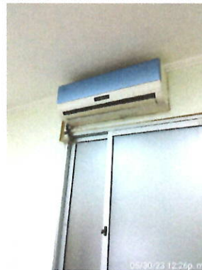
Foto de referencia de Equipo eléctrico