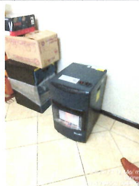
Equipo a gas.