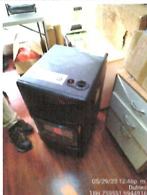
Equipo a gas.