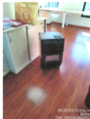
Equipo a gas.