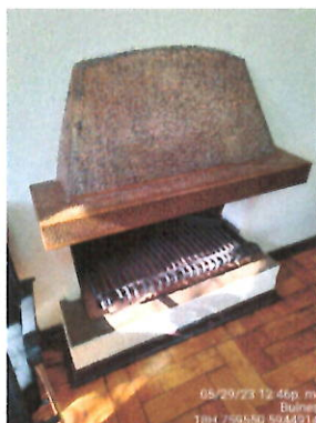
Equipo a leña deshabilitado.