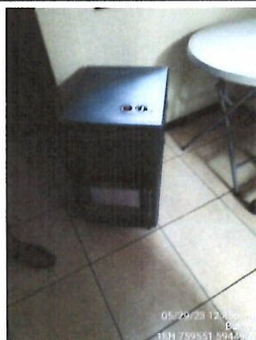
Equipo a gas.