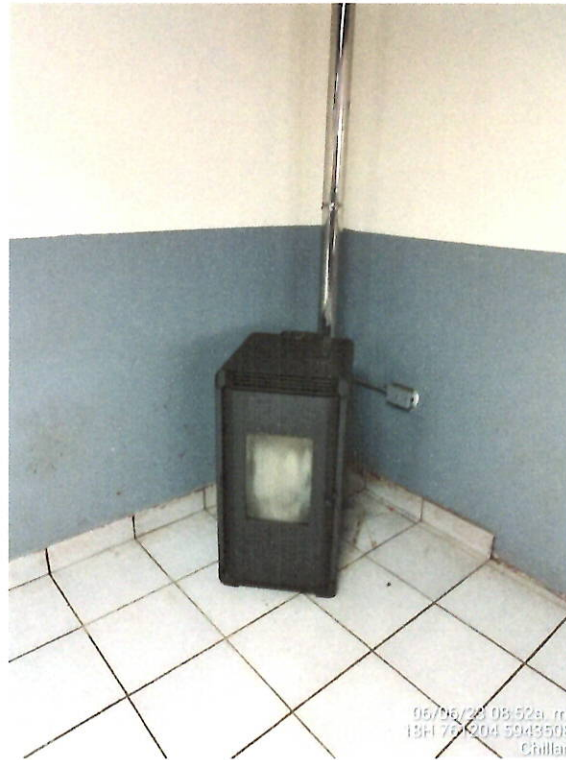
Equipo a pellet habilitado