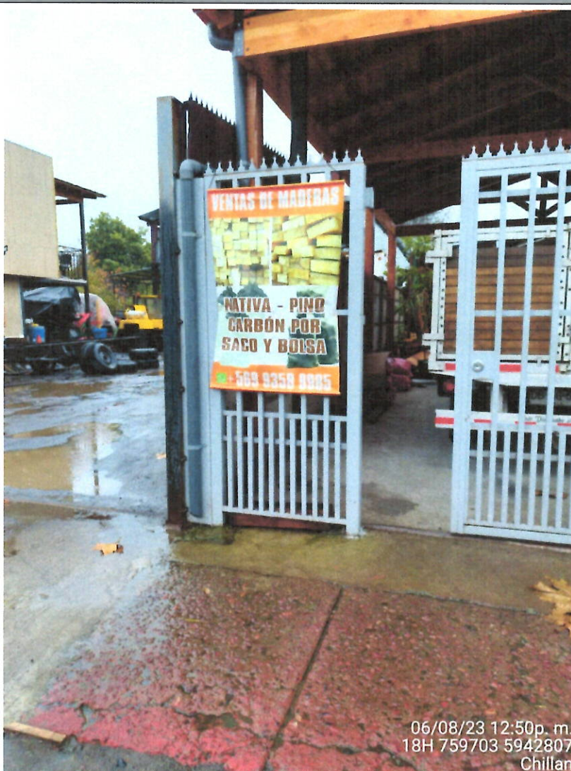
Establecimiento sin venta de leña

Observaciones: ACTA SE REALIZA EN OFICINA Y SE NOTIFICA ELECTRÓNICAMENTE.