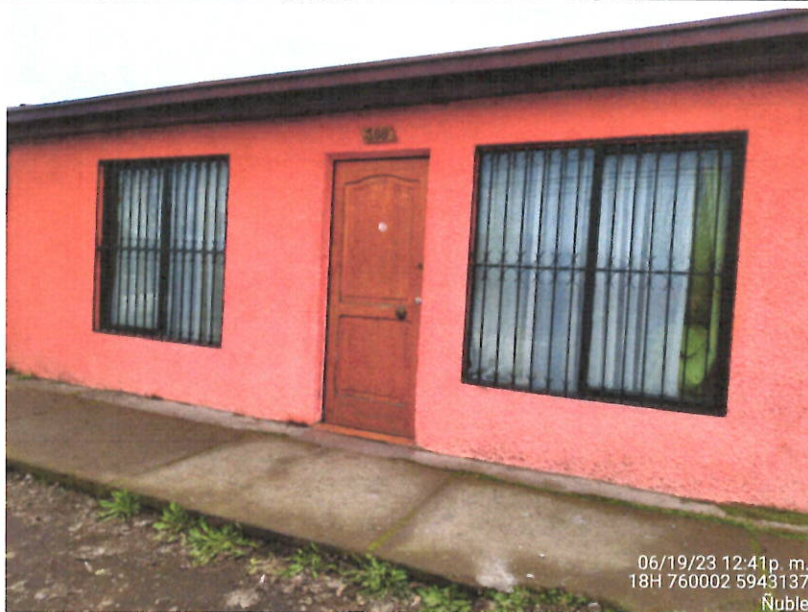
Establecimiento sin venta de leña