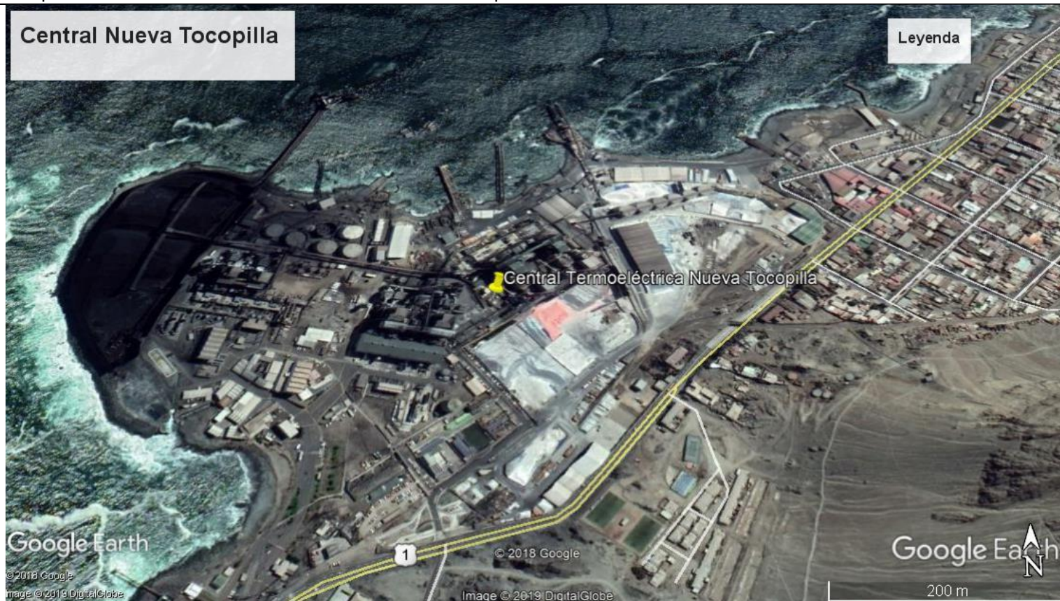
Figura 2 Mapa Ubicación Local Central Termoeléctrica Nueva Tocopilla