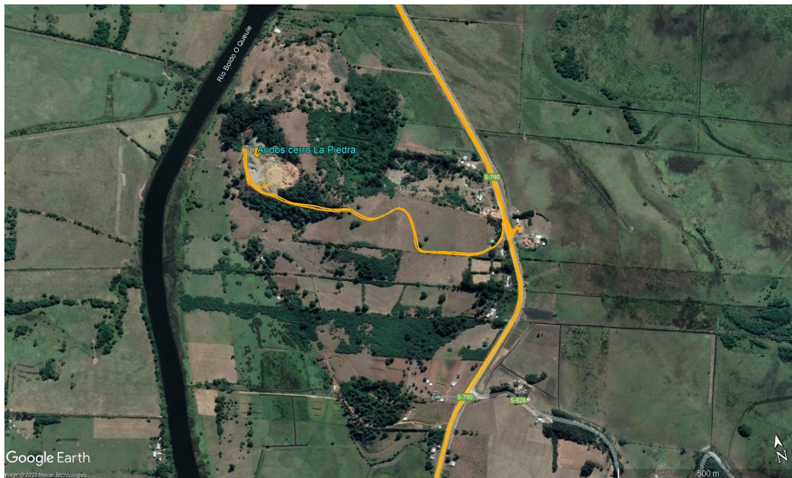
Figura 3. Esquema de recorrido en la UF “EXTRACCION DE ARIDOS CERRO LA PIEDRA.” (línea color naranja), comuna de Nueva Toltén, en fiscalización ambiental de la SMA de fecha 27.06.2023.