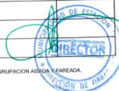
Figura 2. Plan Regulador comuna de Estación Central